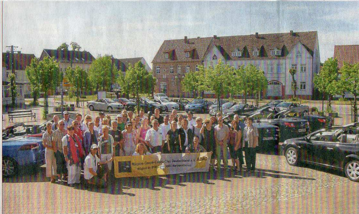
Noch schnell ein Gruppenbild vor ihren Fahrzeugen auf dem Marktplatz in Letzlingen – dann ging die Reise zu Pfingsten nach Mecklenburg los.